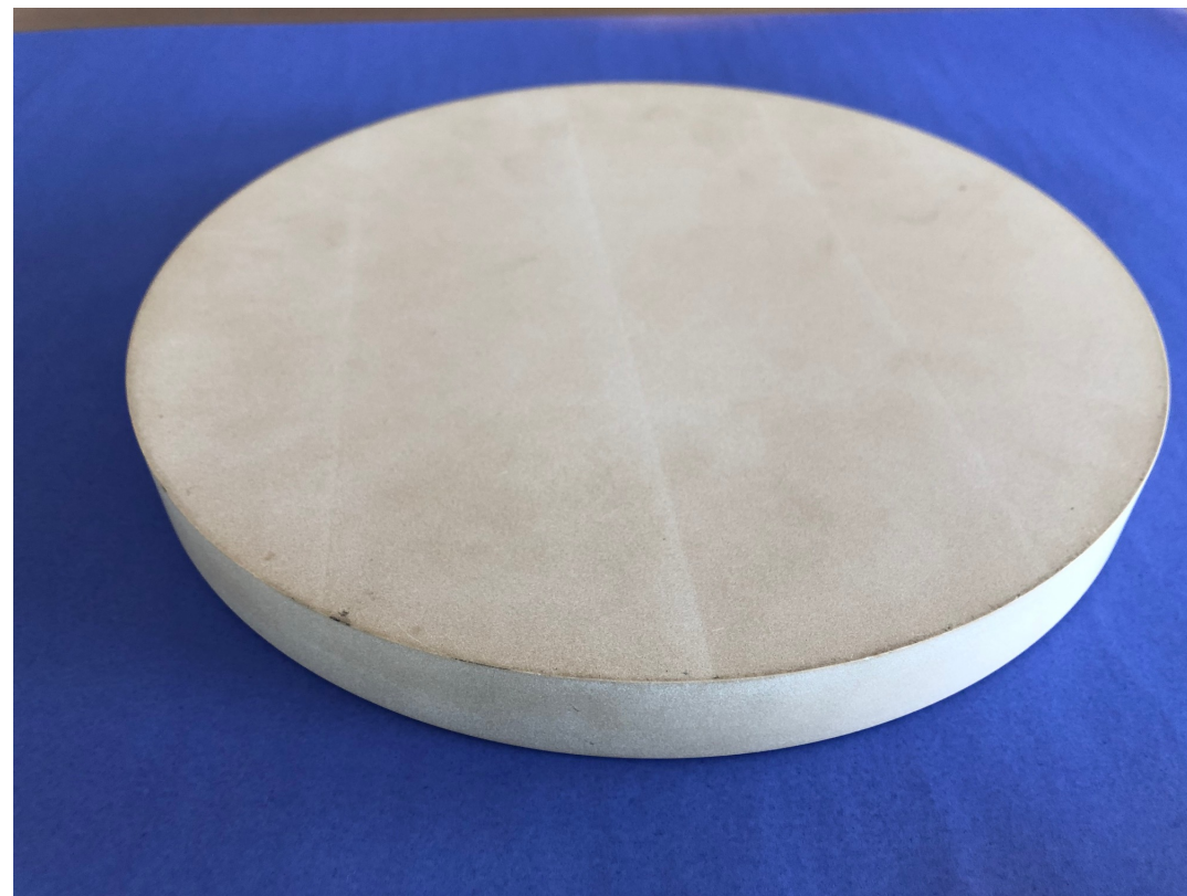
新旧比較(土俵背面)